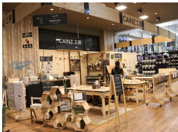
新規導入の「CAFE BRICCO (カフェブリッコ)」(左)と、「CAINZ 工房」(右) ※画像はイメージです