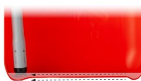
吸い上げやすい底