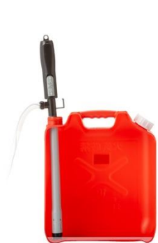
灯油を吸い上げやすい