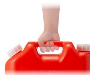
持ちやすい持ち手