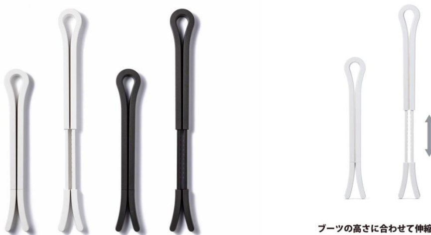
ブーツの高さに合わせて伸縮自在 脚が伸縮する事でブーツにとって最適なサイズに変更できる

装飾を省いたシンプルなデザインと伸縮機能を両立させ、ブーツの長さやデザインにとらわれず使用できるブーツクリップです。それぞれのブーツに合わせて最適な長さに調整できるため、しっかりとブーツを保持しながら、未使用時には省スペースでの収納が可能となります。