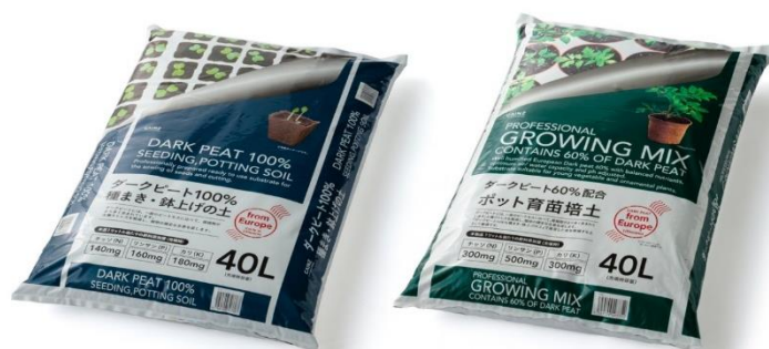
ダークピート100% 種まき・鉢上げの土 40L