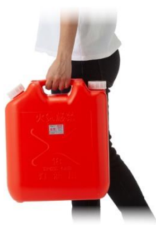
灯油が入った状態でも持ちやすい