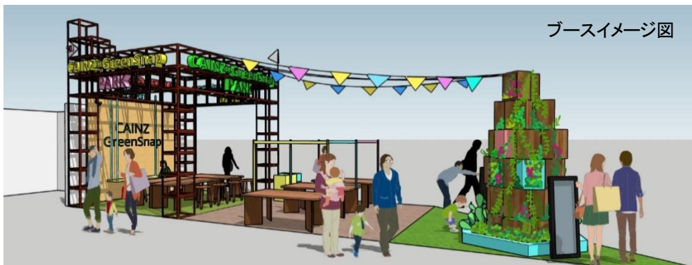
ブースイメージ図

株式会社カインズ（本社：埼玉県本庄市、代表取締役社長：高家 正行）は、2020年2月14日(金)～21日(金)まで東京ドームで開催される「世界らん展 2020」にブースを出展し、DIY ワークショップの開催や、インテリアグリーンやDIY用品などの販売を行います。CAINZ オリジナルワークショップに加え、植物共有アプリ「GreenSnap」とコラボレーションし、ユーザーの人気ワークショップも体験できます。カインズ×GreenSnapならではの、DIYの世界とグリーンの世界を掛け合わせた提案が盛りだくさんのブースで、ものづくりや植物と触れ合う体験を提供いたします。