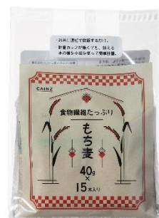
「もち麦スティックタイプ」