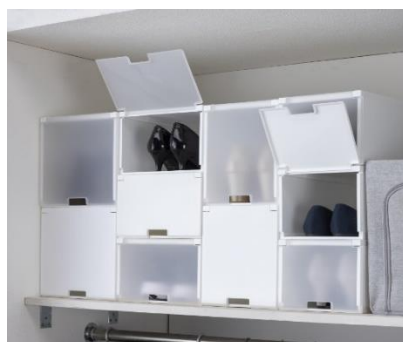
「積み重ねたまま取り出せるケース」