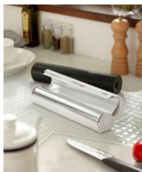
「しっかり切れるホイルケース」