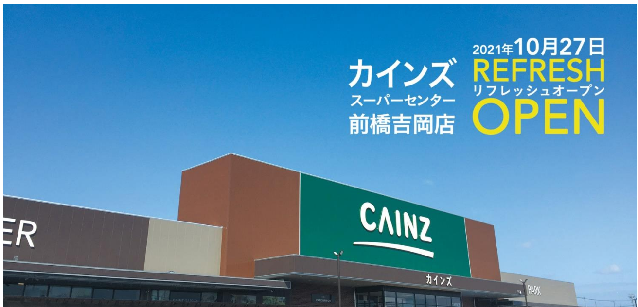
カインズスーパーセンター前橋吉岡店 特設サイトより

カインズスーパーセンター前橋吉岡店は今後も、地域のお客様の豊かで便利なくらしに貢献してまいります。