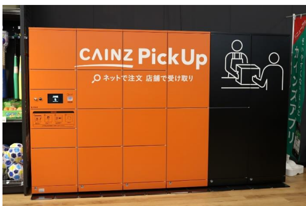
CAINZ Pick Up 専用ロッカー