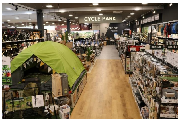
アウトドアコーナー