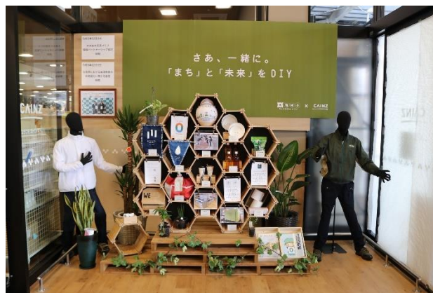
亀岡市×カインズ 環境 PR コーナー

カインズと亀岡市は、オープンに先立ち、12月3日(金)に「かめおか未来づくり環境パートナーシップ協定」を締結しました。カインズ 亀岡店では、環境保全のために、脱プラスチック、資源循環、街美化、カーボンゼロを推進します。マイバックの推進や、ラベルレス商品の販売、マイボトル給水スポットの設置などを通じて、地域の皆様とともに環境都市・亀岡の未来を創造してまいります。合言葉は、『さあ、一緒に。「まち」と「未来」をDIY』です。