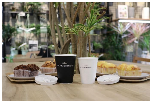
手作りマフィンと挽きたてコーヒー

京都府初出店となる CAFE BRICCO (カフェブリッコ) では、手作りマフィンと 1 杯ごとの挽きたてコーヒー、注文後に茶笥で点てて作る濃い抹茶ラテが大人気。緑ある空間でゆっくりとおくつろぎいただけます。また酒どころ・京都ならではの甘酒、甘酒抹茶も販売予定。また、脱プラスチックの一環で、使用するカップ、ふた、ストロー、マドラー、スプーンなど容器資材には紙製品を採用しています。(コールド商品のカップ、ふたには、リサイクルペットボトル約 25% 使用品を採用)