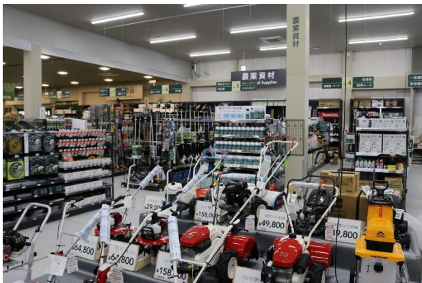
農業資材コーナー

毎日の生活に欠かせない日用雑貨コーナーや、機能性、デザイン性のある商品を揃えたインテリア用品コーナー、トリミング、ペットホテルも完備したペット専門店のペットワンなどを展開しているのに加え、地域でのニーズが多い、農業・工業・園芸用資材、リカー（お酒）、リフォーム関連コーナーは売り場を充実させました。物置・カーポート・外構のご相談お見積りからアフターフォローまでお手伝いするエクステリアプラザもございます。各コーナーではグリーンアドバイザー等の専門知識を持ったメンバー（従業員）が、お客様のご要望にあった提案を行います。