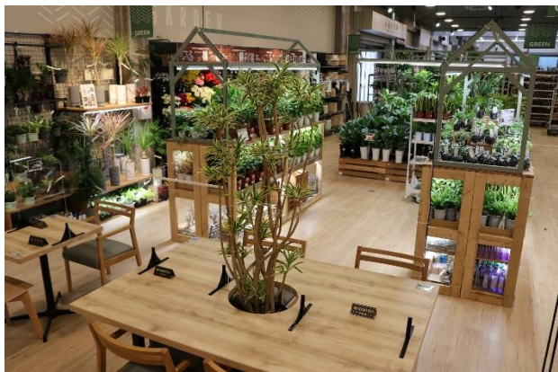
グリーンコーナー