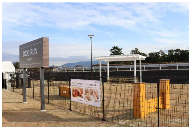
スマートドッグラン

カインズ 亀岡店は、カインズならではの Kindness (親切) なサービスで、皆様をお迎えします。