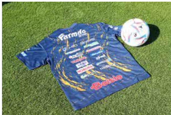
限定 T シャツ(裏)