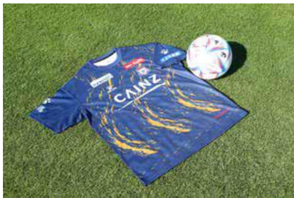
限定 T シャツ(表)

詳しくはザスパクサツ群馬ホームページ( https://www.thespa.co.jp/ )にてご確認ください。