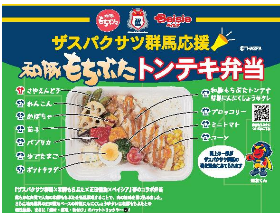
「ザスパクサツ群馬応援 和豚もちぶたトンテキ弁当」

ベイシアは 2004 年 12 月より、ザスパ草津(当時の名称)の JFL リーグから J2 への昇格を支援し、現在はザスパクサツ群馬とオフィシャルユニフォームパートナー契約を締結。メインスポンサーとして応援しています。これまで、ザスパクサツ群馬の選手・スタッフと県民・サポーターの皆様の接点を増やすため、シーズン直前の決起集会、スペシャルマッチなどのイベントを実施。また、主要店舗でオフィシャルショップを展開し、物販だけでなく、県民・サポーターに向けた情報発信機能を果たしています。2021 年にはザスパクサツ群馬、グローバルピッグファームとコラボし、「ザスパクサツ群馬応援 和豚もちぶたトンテキ弁当」を販売。多くのお客様にご好評いただき、売上の一部を強化基金としてザスパクサツ群馬へ贈呈いたしました。今後も様々な側面からザスパクサツ群馬の活動を後押しすることで、地域の活性化に取り組んでいます。