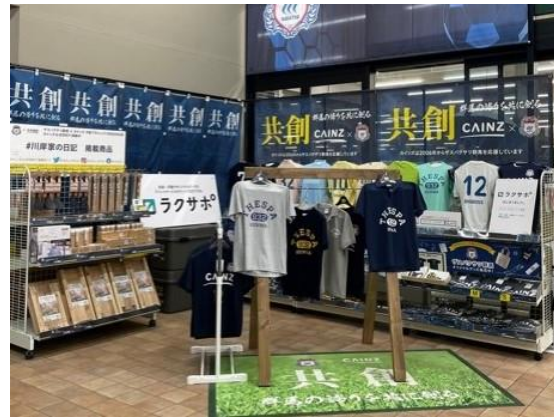
オリジナルグッズ販売コーナー