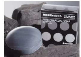
無添加炭配合石鹸