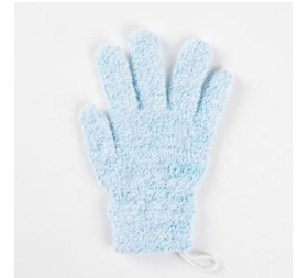
肌ざわりソフトな浴用手袋