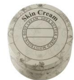
シアバター配合 スキンクリーム