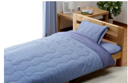
「もっとひんやり肌ふとん」

「もっとひんやり敷きパッド」「もっとひんやり枕パッド」は、“強冷感”のニット面と“瞬間消臭”のパイル面がリバーシブルになった、消臭性と抗菌性に優れた冷感寝具です。強冷感のニット面は、触れると冷たさを感じる“接触冷感”生地を使用。直接肌が触れた際に、肌表面の熱が移動することによって強冷感を感じます。また、接触した部分だけが冷たく感じるため、布団の不快な熱気を抑えて適度に体をクールダウンさせ、体の芯まで冷やしすぎないのが特徴です。人は寝ている間に