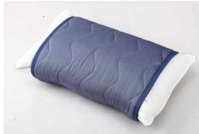
「もっとひんやり枕パッド」