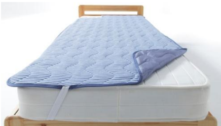
「もっとひんやり敷きパッド」

株式会社カインズ（本社：埼玉県本庄市）は、発売以来大好評の冷感寝具シリーズより、寝返りを打つたびにひんやり気持ちいい「もっとひんやり敷きパッド」「もっとひんやり枕パッド」と「もっとひんやり 肌ふとん」を5月18日（月）新発売しました。