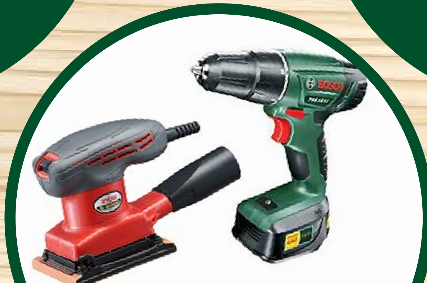
ドライバー サンダー