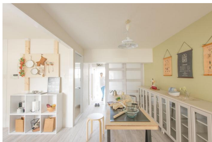
モデルルーム(Bタイプ)

名古屋市の市営住宅では、入居者の高齢化等が進む中、団地によっては自治会活動の停滞や高齢者の孤立化等が課題となっています。「市営高坂荘」でも高齢(65歳以上)の入居者が約6割を占めており、地域コミュニティ機能低下の課題を抱えています。これらを改善するため、名古屋市住宅供給公社では、「市営高坂荘」をリノベーション。カインズが、そのモデルルームをコーディネートすることとなりました。カインズのスタイリッシュでアイデア溢れる商品を使って、現代の子育て世代に魅力ある住まいを提案することで、子育て世代の入居促進と地域コミュニティの活性化を目指します。