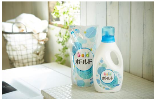
商品名: ボールドジェル リフレッシュグリーン&サボンの香り 価格: 本体 228 円、詰替 248 円 協業: プロクター・アンド・ギャンブル・ジャパン株式会社

家事など毎日の生活シーンを楽しくするような、カインズオリジナル商品ともマッチさせたデザインです。自分らしく「つくる」という、カインズの DIY 提案と連動するコンセプトの商品も登場します。