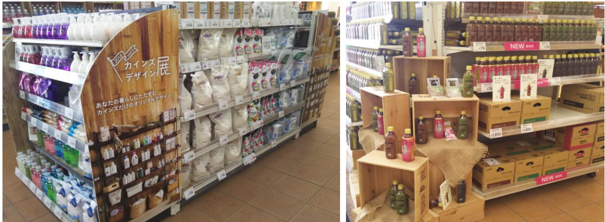
▲前回(2018年5月26日~6月18日)店頭展開の様子