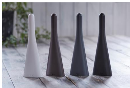
商品名: 立つ卓上ほうき 価格: 598 円