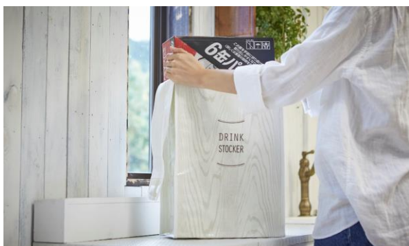
商品名: スーパードライケースストッカー付 価格: 4,880 円 / 協業: アサヒビール株式会社 (※価格は特売などにより変動します)