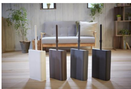
商品名: 立つほうき/立つちりとり 価格: 1,280 円/698 円

国内外のデザイン賞を多く受賞しているカインズオリジナル商品。中でも「立つ」掃除用品シリーズは、ほうき、ちりとり、卓上ほうき、フローリングワイパーとシリーズ拡大中。生活空間になじむデザインとカラーで、掃除したい時にすぐ手にとれる場所に置いておくことができます。