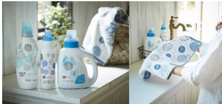
商品名: アタック 抗菌 EX スーパークリアジェル アタック Neo 抗菌 EX W パワー ハミングファイン(※11月発売予定) 価格: 348 円 / 協業: 花王株式会社