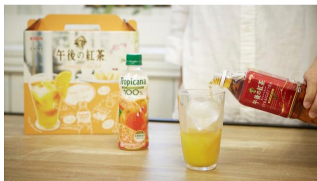
商品名: 午後の紅茶 アレンジティーキット 価格: 398 円 / 協業: キリンビバレッジ株式会社