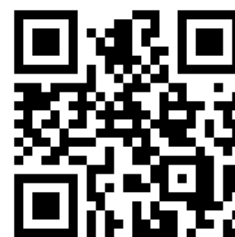
高儀クイズ回答フォーム