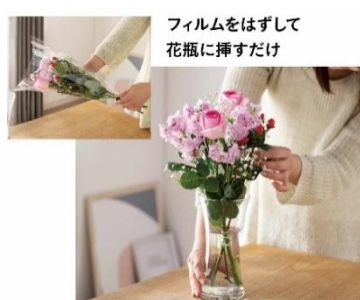
フィルムをはずして 花瓶に挿すだけ

「Fulara」は家庭で飾るのにちょうど良い長さで生産・出荷・販売することで、廃棄やゴミを削減し環境負荷を少なくしたエコなお花です。また、飾る際に茎を切る必要が無いため、持ち帰ってすぐに飾ることができるなど、家庭における手間も減らし、暮らしを花で彩りたいお客様、ひとり一人をサポートします。