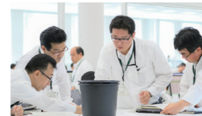
Product Planning/Designing 商品企划 / 产品设计

为了能够做到“让好产品更便宜”、“总是不变的低价格”，从产品开发到设计、生产、品质管理、物流、产品宣传和销售，家盈知对整个流程实施一贯性管理。