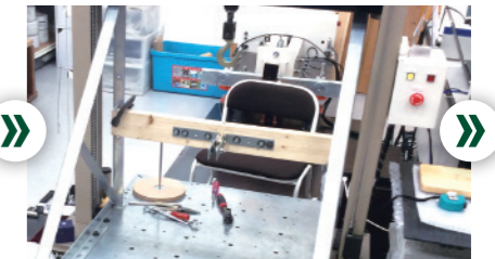
Production Control/ Quality Control 生产管理 / 品质管理