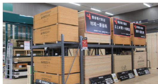
Lumber & Building Material 资材·工具