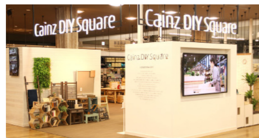
DIY Product (Power Tools & Hand Tools) DIY手工制作