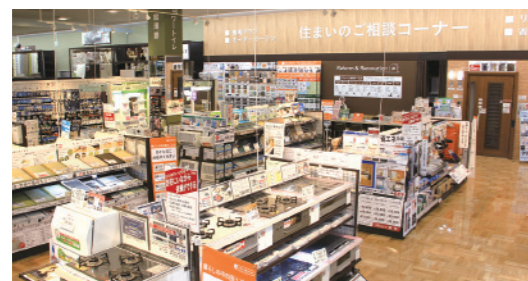
Remodeling Centers & Exterior Plazas 装修中心 & 室外用品市场