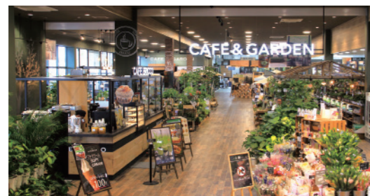
Gardening & Plants 园艺