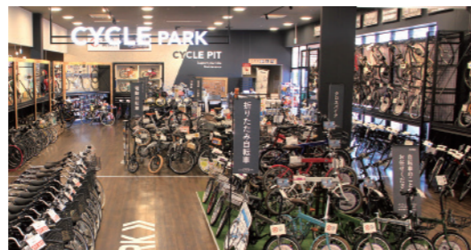
Bicycle & Sports 自行车·体育用品