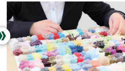
Production base development/ Material procurement 产品开发 / 原料采购