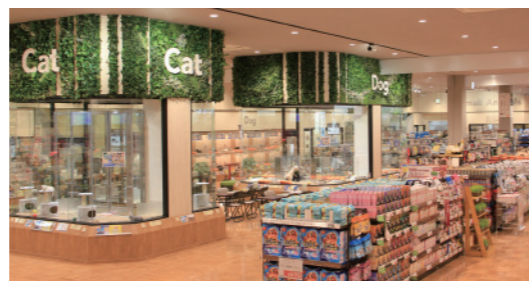
Pet Food & Pet Supplies 宠物